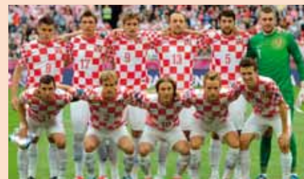
Hrvatska nogometna reprezentacija 2012.