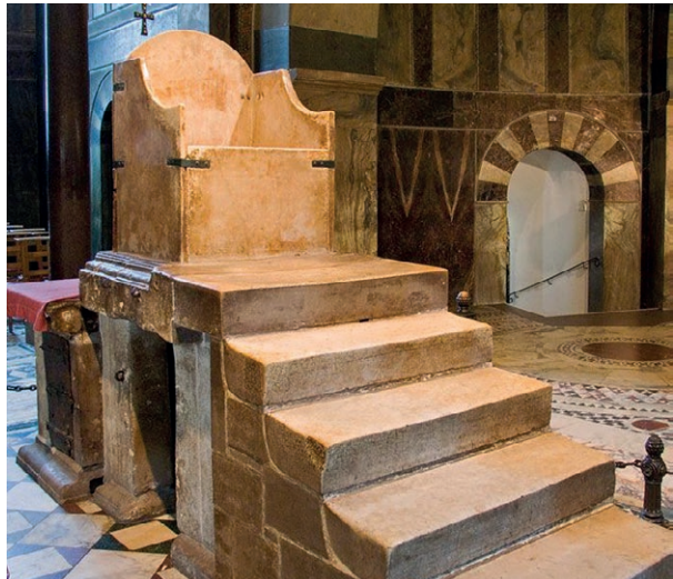
prijestolje Karla Velikog u katedrali u Achenu

Premda nije znao ni čitati ni pisati, Karlo Veliki poticao je učenje i pismenost. Na svoj dvor doveo je poznate učene ljude. Dao je prepisivati knjige grčkih i rimskih pisaca. Za svoje mnogobrojne sinove i kćeri na dvoru je otvorio školu. Ujedno je naredio da samostani otvaraju škole za školovanje budućih redovnika i svećenika. Njegov dvor u Achenu (Ahenu) bio je središte kulturnog procvata.