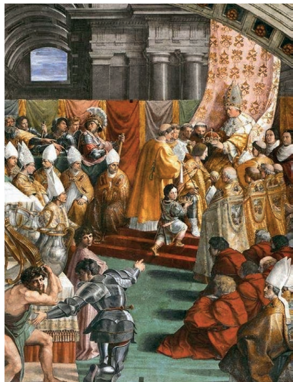
Rafael Sanzio: Krunidba Karla Velikog

Karlo Veliki želio je obnoviti Zapadno Rimsko Carstvo što se i ostvarilo dana 25. prosinca 800. godine. U Rimu, u crkvi Svetog Petra papa Lav III. okrunio je Karla za cara Rimskog Carstva. Otad su postojala dva carstva: Zapadno (Franačko) i Istočno Rimsko Carstvo (Bizant). Carsku krunu Karlu nije priznalo Istočno Rimsko Carstvo. Car Istočnog Rimskog Carstva smatrao se jedinim rimskim carem. Zbog toga dolazi do rata koji nije donio pobjednika. Rat je završio mirom u Aachenu 812. godine. Njime je Istočno Rimsko Carstvo priznalo Karlu titulu cara Franaka.