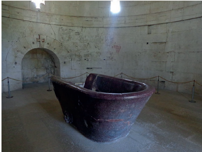
Teodorikova grobnica u Ravenni. Grobnica je izrađena od istarskog kamena, u središtu se nalazi škrinja bez poklopca u kojoj je možda bio pokopan Teodorik.

Vandali su naselili područje na zapadu Sjeverne Afrike. U jednom napadu došli su i do Rima. Bilo je to 455. godine kada su Rim četrnaest dana pljačkali i jako razrušili. Prema Vandalima, svako namjerno uništavanje i razaranje nazivamo vandalizam, a ljude koji razbijaju i uništavaju nazivamo vandalima.