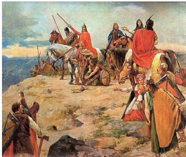
Oton Iveković: Dolazak Hrvata na Jadran

Zbog malog broja pisanih i arheoloških izvora ne znamo sa sigurnošću gdje su Hrvati živjeli prije seobe. Znamo da današnji hrvatski narod po svom jeziku pripada južnoj skupini Slavena i da je dolazak trajao dulje vremensko razdoblje. Pretpostavlja se da je počeo krajem 6. i početkom 7. stoljeća, a završio krajem 8. i početkom 9. stoljeća. Isto se tako pretpostavlja da su Hrvati došli iz današnje Češke i južne Poljske. Ti su se krajevi nekada nazivali Bijela Hrvatska. Naselili su područje rimske provincije Dalmacije.