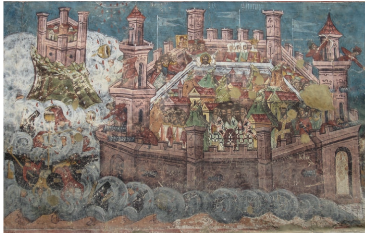
Opsada Konstantinopola 626. godine, slika na zidu manastira u Rumunjskoj

Avari su dio Slavena pokorili, a s ostalima su sklopili savez. Avarska i slavenska vojska nadopunjavale su se: Avari su bili konjanici, dok su Slaveni bili pješaci. Slaveni i Avari krenuli su prema jugu i došli do granice Istočnog Rimskog Carstva. Čak su 626. godine napali glavni grad – Konstantinopol. Avari i Slaveni opkolili su grad s kopna, a Perzijanci brodovima s mora. Grad su držali u opsadi nekoliko mjeseci, ali ih je bizantski car Heraklije uspio pobijediti. Grad se spasio zahvaljujući visokim i jakim zidinama te bizantskim ratnim brodovima. Nakon neuspjeha savez se raspao, a Avari su se povukli u Panonsku nizinu. Slaveni su mirno i uz dozvolu cara naselili područje Istočnog Rimskog Carstva te počeli stvarati svoje države. Među njima bili su i Hrvati.