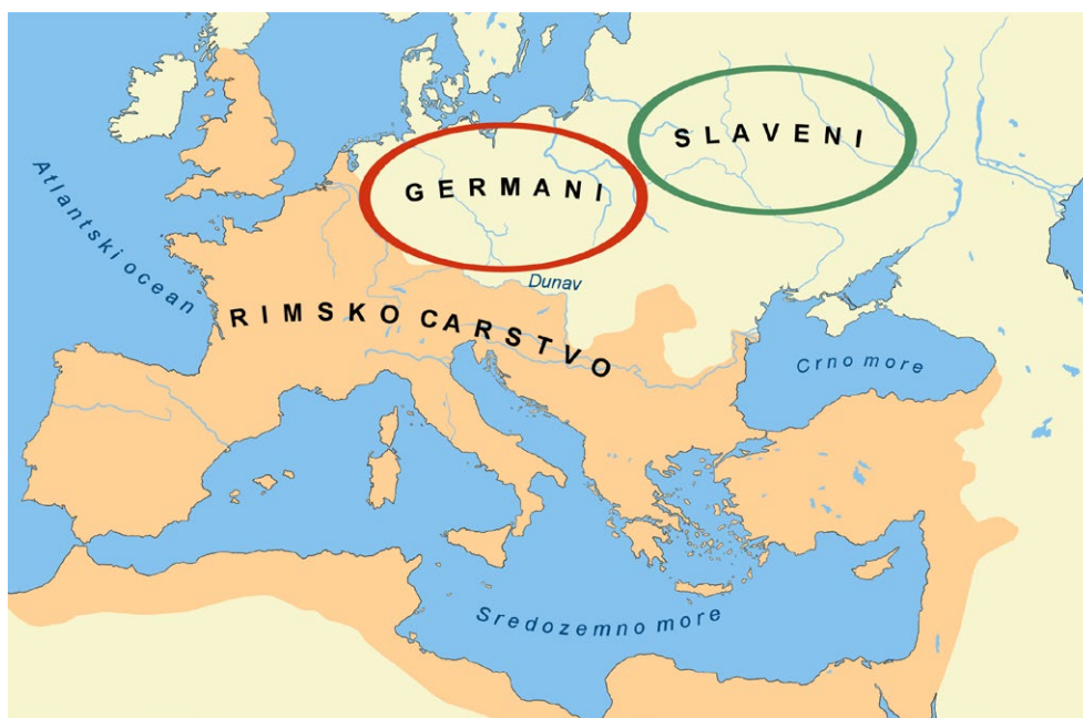
Područja Germana i Slavena

Potkraj 4. stoljeća u Europu su iz Azije provalili ratnici Huni . U strahu od Huna, Germani su bježali prema zapadu i naseljavali se unutar Rimskog Carstva. Počela je seoba naroda koja je donijela velike promjene unutar i izvan granica Rimskog Carstva. Seoba naroda je razdoblje od 4. stoljeća do 9. stoljeća tijekom kojeg su se mnogi narodi preselili na nova područja.