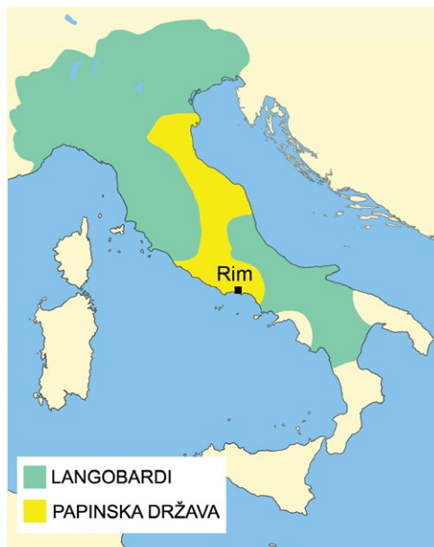
Langobardi i Papinska država

Karla Martela naslijedio je sin Pipin Mali . Njega je 751. godine blagoslovio papa. Pipin Mali je bio prvi franački kralj iz nove dinastije Karolinga . Otad počinje povezanost pape i vladara Franačke. Pipin Mali pomogao je papi u borbi protiv Langobarda, naroda koji su vladali sjevernom Italijom i koji su često napadali papine posjede. Pokorivši Langobarde, Pipin Mali osvojeno je područje predao papi. Tako je 756. godine nastala Papinska država sa središtem u Rimu. Papinska država trajala je do 1870. godine.