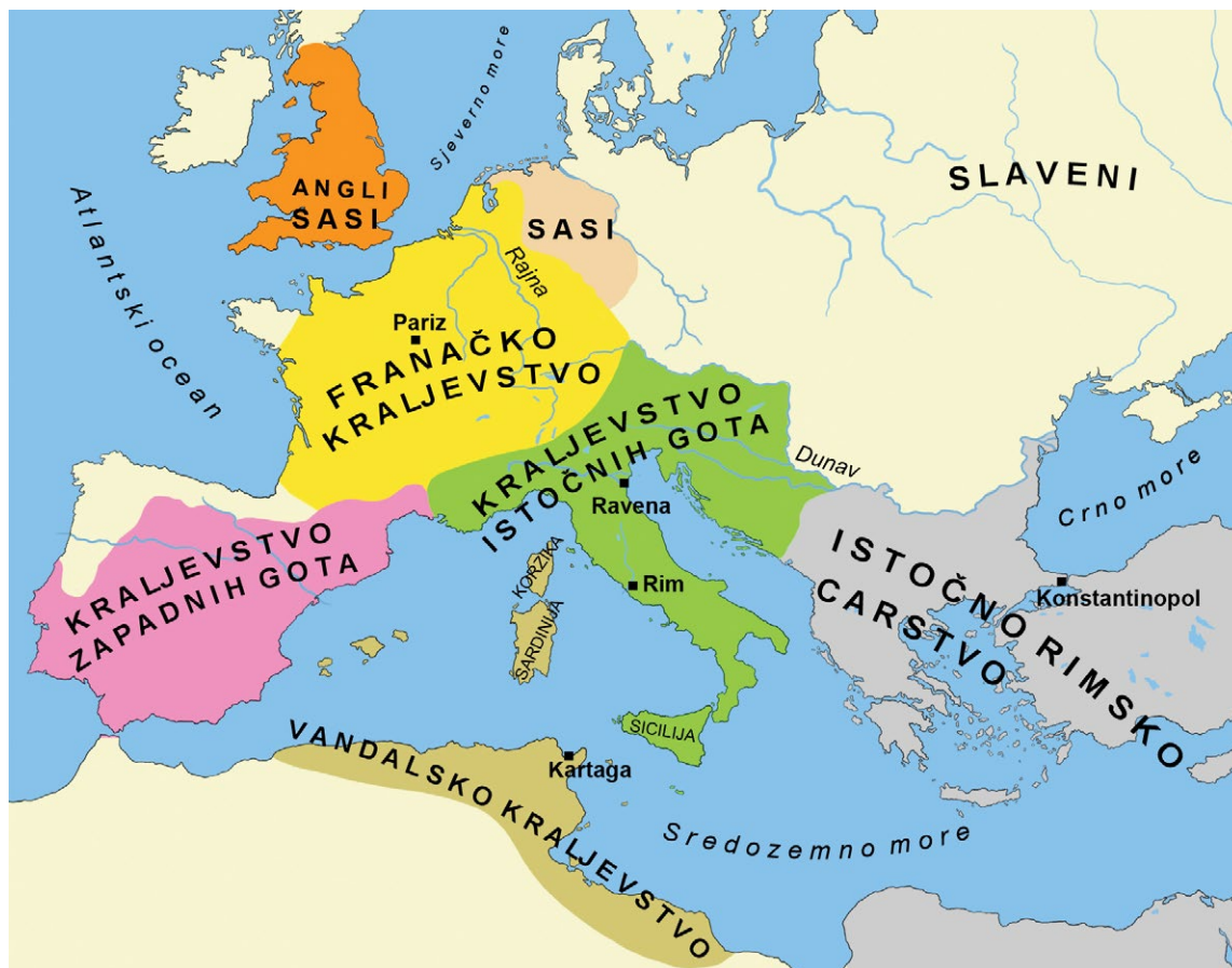
Europa početkom 6. stoljeća

Na području Zapadnog Rimskog Carstva Germani su počeli stvarati svoje države. Najvažnije države stvorili su Franci, Zapadni Goti ili Vizigoti, Istočni Goti ili Ostrogoti, Angli i Sasi te Vandali. Franci su se naselili na područje rimske provincije Galije (današnja Francuska). Njihova država za kratko vrijeme postat će najmoćnija u Europi.