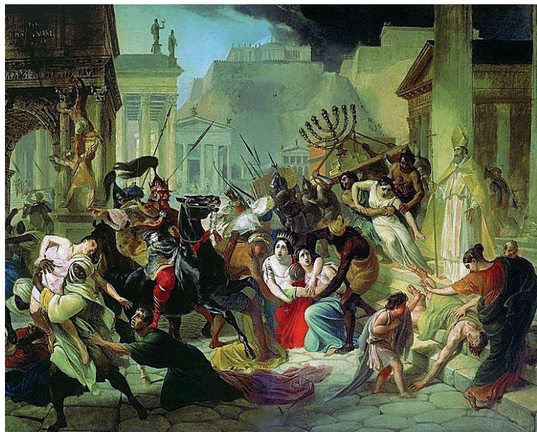
Karl Briullov: Vandali napadaju Rim

Vandali su naselili područje na zapadu Sjeverne Afrike. U jednom napadu došli su i do Rima. Bilo je to 455. godine kada su Rim četrnaest dana pljačkali i jako razrušili. Prema Vandalima, svako namjerno uništavanje i razaranje nazivamo vandalizam, a ljude koji razbijaju i uništavaju nazivamo vandalima.