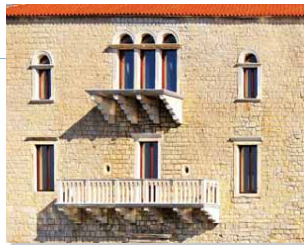
dvorac Vitturi, Kaštel Lukšić

Legenda o Miljenku i Dobrili govori o nesretnoj ljubavi dvoje mladih iz 16. stoljeća. Toj su se ljubavi protivile njihove suprotstavljene obitelji Rušinić i Vitturi, što dovodi do tragedije. Pokopani su zajedno u crkvi sv. Ivana u Kaštel Lukšiću. Na njihovu vječnom počivalištu uklesana je poruka „Pokoj ljubovnicima”. Priču je opjevala klapa Sv. Juraj, „Ružo crvena”.