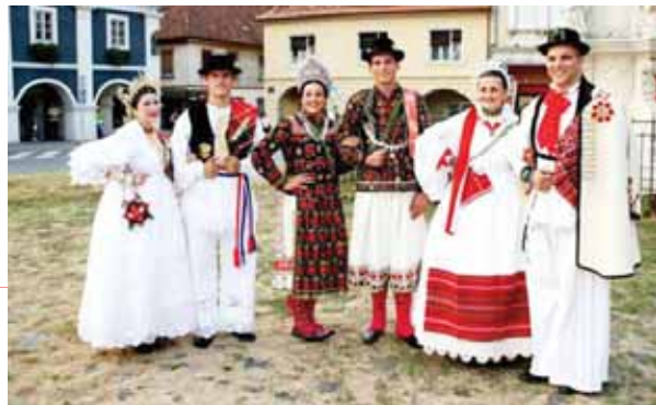
mladenci iz Luča

Svatovske dužnosti povjeravale su se članovima obitelji. Ugledan muškarac vodio je svadbena zbivanja i njega su najčešće nazivali starješina . Važan je bio i pravi kum , odnosno kum s mladoženjine strane. Nakon njih dolaze kum ili djever s mladenkine strane, barjaktar ili zastavnik koji je nosio zastavu te svatovski veseljak ili čauš čiji je zadatak bio uveseljavati svatove. Odjeći mladenaca pridavala se velika važnost, pogotovo mladenkinu velu ili kruni. U starije su vrijeme bili domaće izrade od pravog ili umjetnog cvijeća, stakalaca i ukrasnih vrpca. Odlazak po mladenku uključuje osobit trenutak kad se udavača pojavljuje pred svatovima i oni je preuzimaju od ukućana. Ovo se svadbena zbivanja odvija pred vratima i pred svatove nerijetko tada izlazi lažna mlada te se razvija šaljivo pogađanje predstavnika obiju strana. Nakon ulaska u kuću, počinje glazba i zdravice, na primjer iz Podravine: Bog neka živi ove mladence, koji su danas u hižni zakon stupili, da ih Bog više godina uzdrži u zdravlju i blagoslovu .